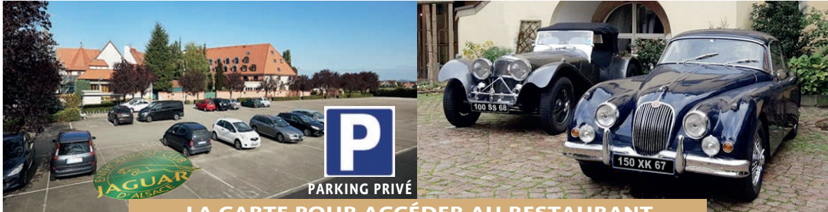
LA CARTE POUR ACCÉDER AU RESTAURANT

VOTRE INSCRIPTION (OU VOTRE POUVOIR) EST À RETOURNER AVANT LE 4 NOVEMBRE. VOYEZ EN PAGES SUIVANTES