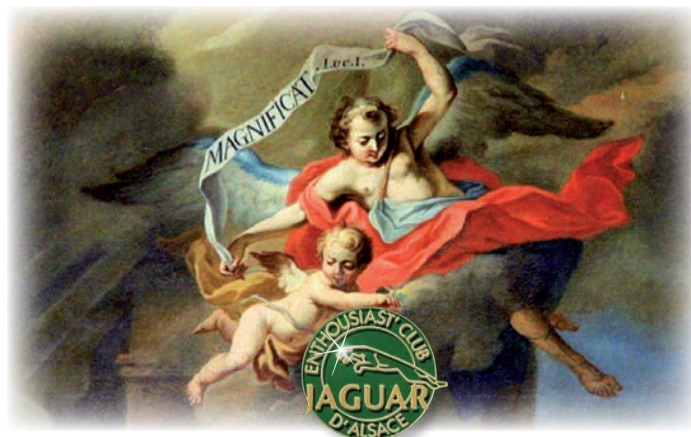
Peinture dans la chapelle Notre-Dame du Schauenberg